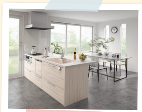
リビング ステーション Vスタイル

それで彼女、この頃イキイキしているんだわ。空き家をそんな風に 活かす方法もあるのね。さて、わが家の空き部屋も何か活用できないかな？