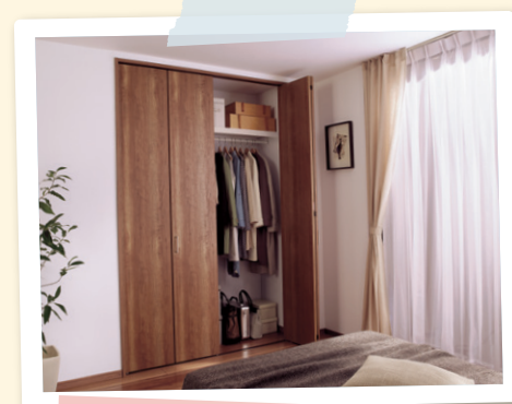
収納用建具 折れ戸

木目柄と庭の緑が疲れを癒してくれる 快適なバス。汚れにくいスゴピカ浴槽と スミピカフロアで、お掃除もラクラク♡