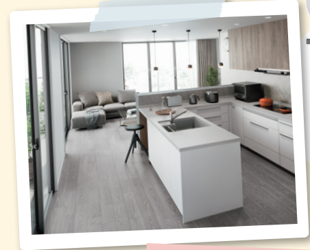
レクラスキッチン・idobata

家に帰ったら、すぐに手洗い。うがい。衛生習慣が身につくし、お出かけ前の身だしなみチェックもできるわ！