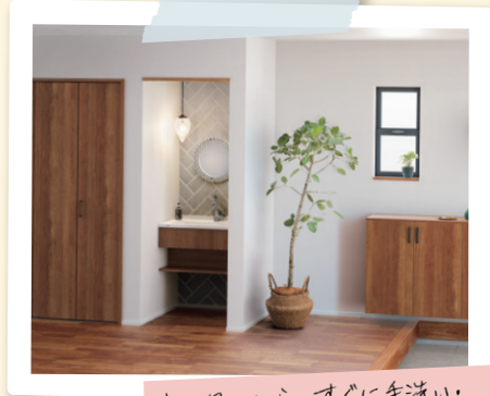
玄関洗面・シーライン

洗面室に全自動洗濯機を設置。横にウォークインクローゼットがあれば、乾いた洗濯物をすぐに収納できて効率的ね！