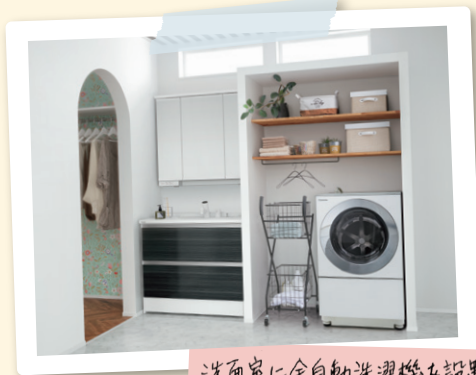
洗面ドレッシング・シーライン

これから先、足腰が弱ってくると、買物袋を抱えての台所までの距離や2階の物干しへの階段が苦痛になるかもしれない。リフォームする時は、古い設備の入れ替えだけでなく、暮らし方に合わせた動線もしっかり考えておかなければ